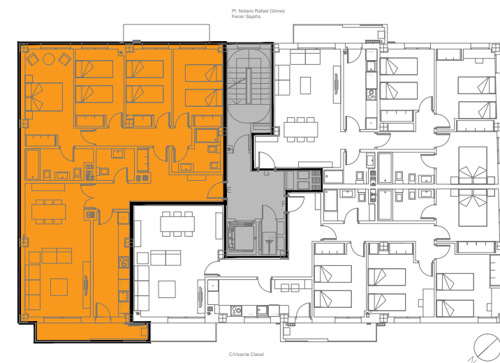
PLANTAS 4ª, 5ª, 6ª y 7ª. VIVIENDA TIPO - E